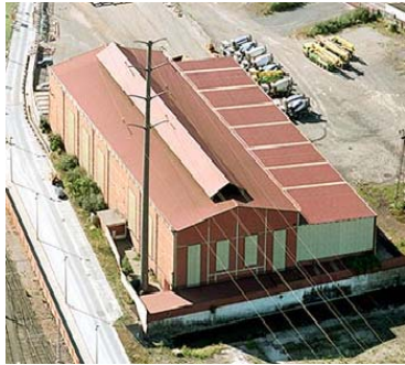
SESTAO CORTE COORDENADAS GPS N 43.30818° W 2.99270°