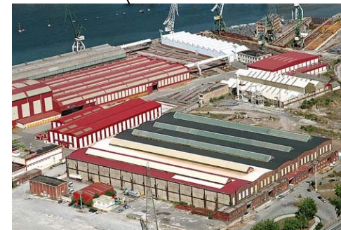
SESTAO LAMINACION COORDENADAS GPS N 43.30670° W 2.98787°